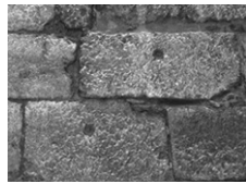
Sur les murs de ce bâtiment de la période médiévale