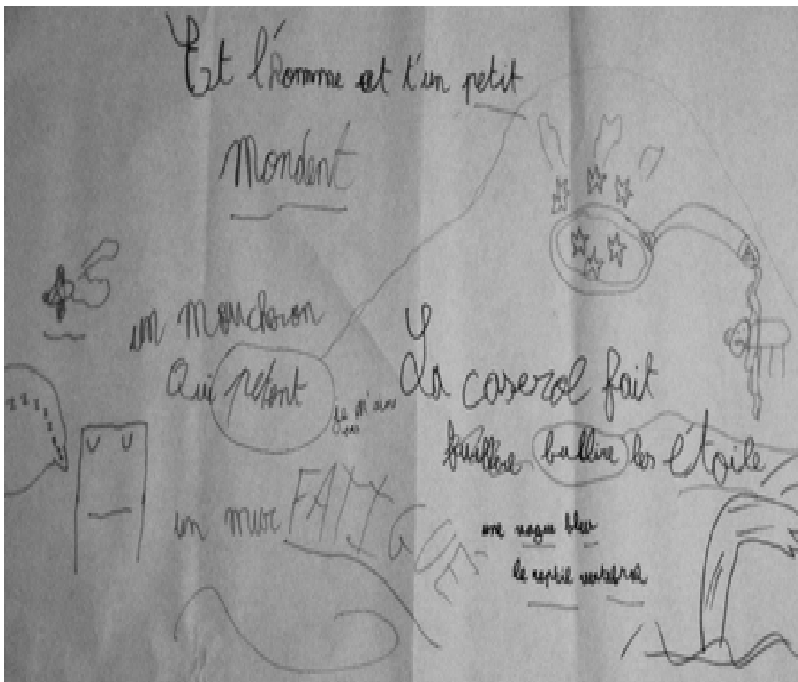
Atelier 3 « Poésie contemporaine », un bout de la fresque des CE1.