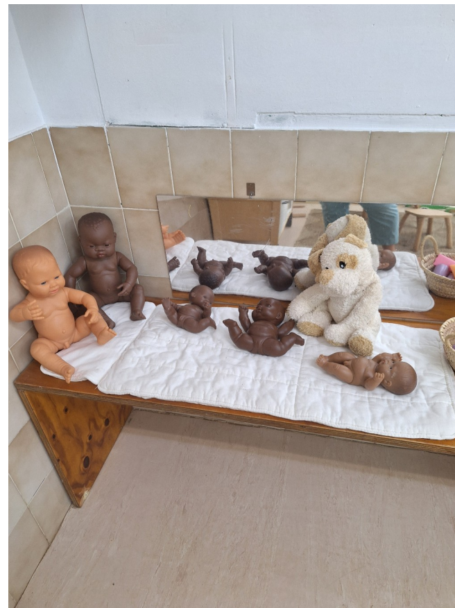
Des poupées sexuées et ethniques