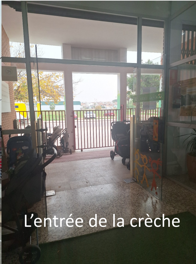
L'entrée de la crèche