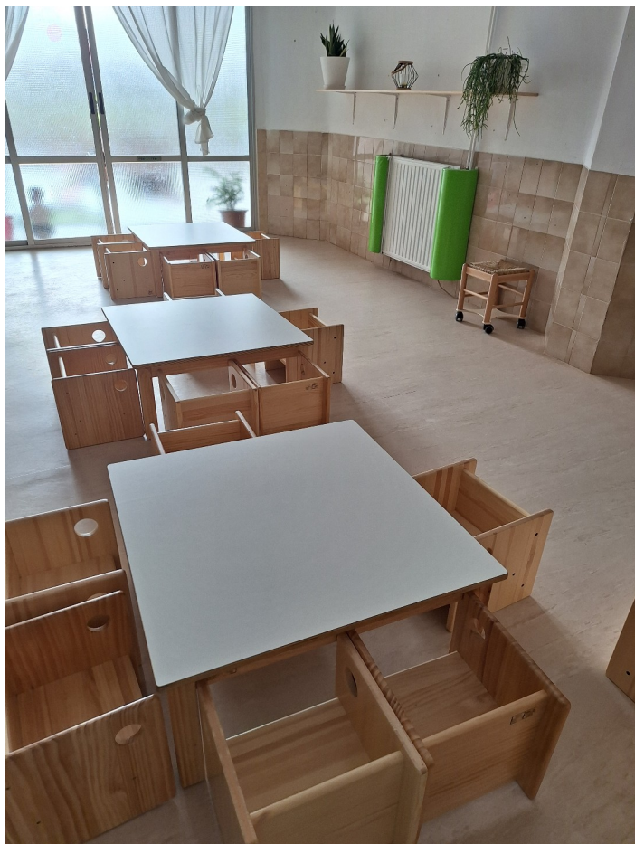
La salle de repas