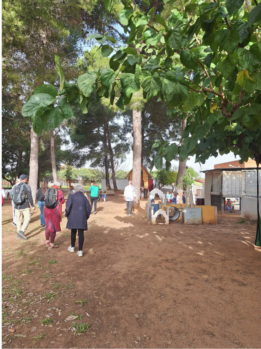
Le grand jardin