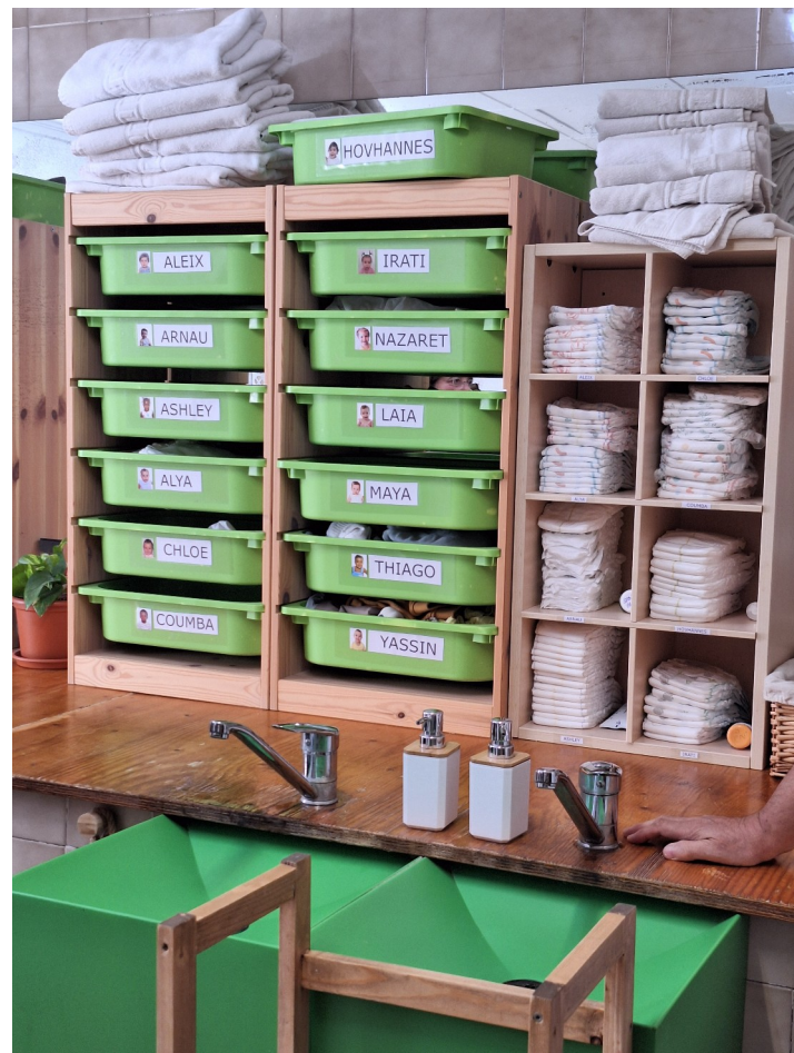
La salle de change